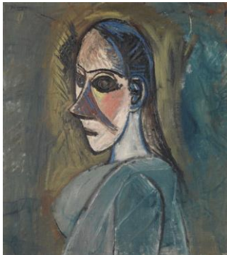
Pablo Picasso, Buste de femme 1907, étude pour les Demoiselles d'Avignon