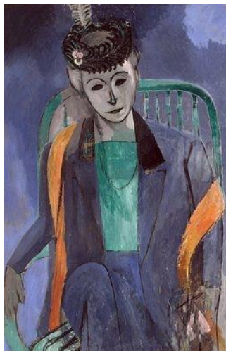
Henri Matisse, Femme de l'artiste , 1913