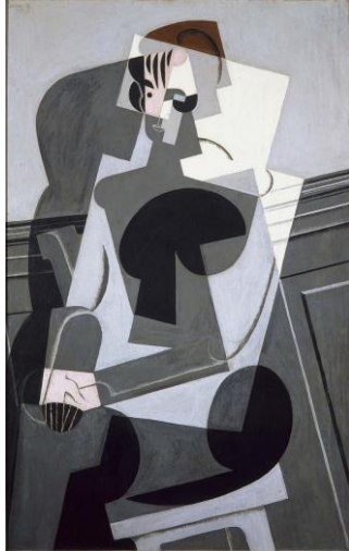
Ruan Gris, Portrait de Josette , 1916